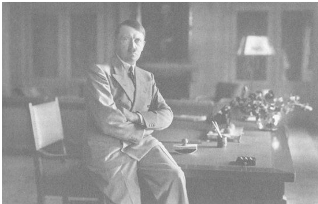
Хитлер в кабинета си в новата Райхсканцелария. Една от редките му снимки в граждански костюм след 1935 година.

- Върнете ми стария похлупак такъв, какъвто си беше. Аз ще нося шапката, не вие.