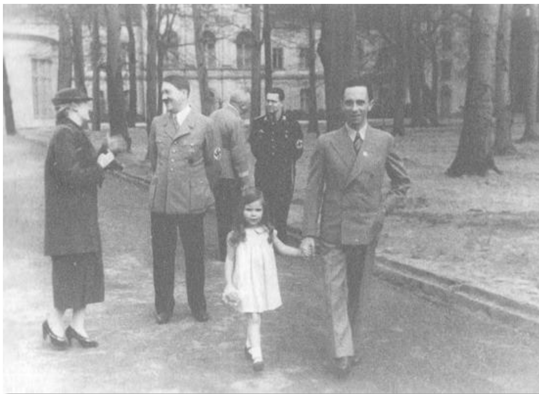
Хитлер изпраща в парка на Райхсканцеларията Магда и Йозеф Гьобелс.

старите си бойни другари, говореше само и негова полза. Наказаните, естествено, смятаха, че им режат крилата против волята на Фюрера и организираха протестна акция пред Министерството на пропагандата, но срещнаха гранитен отпор. Хитлер застана зад Гьобелс, който не се остави да бъде спласен. При заемаването на важни постове обаче, такова беше изричното желание на Хитлер, и занапред първо трябваше да се проверява дали сред старите партийни другари има такива, които да отговарят на изискванията за съответните длъжности. Ако не, за тях винаги имаше достатъчно служби, на които да бъдат назначени без непременно да се правят ненужни жертви. По-късно Хитлер се върна на тази тема и призна, че Ататюрк, турският държавен глава, с право го е упрекнал, че е прекалил с предпочитанията си към старите бойни другари и много от тях е облякъл в дрехи, които не са им по мярка. Но макар и да признаваше това, все пак намираше оправдание: „Имам много гаулайтери, които идват от най-обикновени семейства, но изпълняват съвестно задълженията си“. И действителност нещата стояха така: всеки, който поне в общи линии се справяше със „службата“ си, оставаше там докрай.