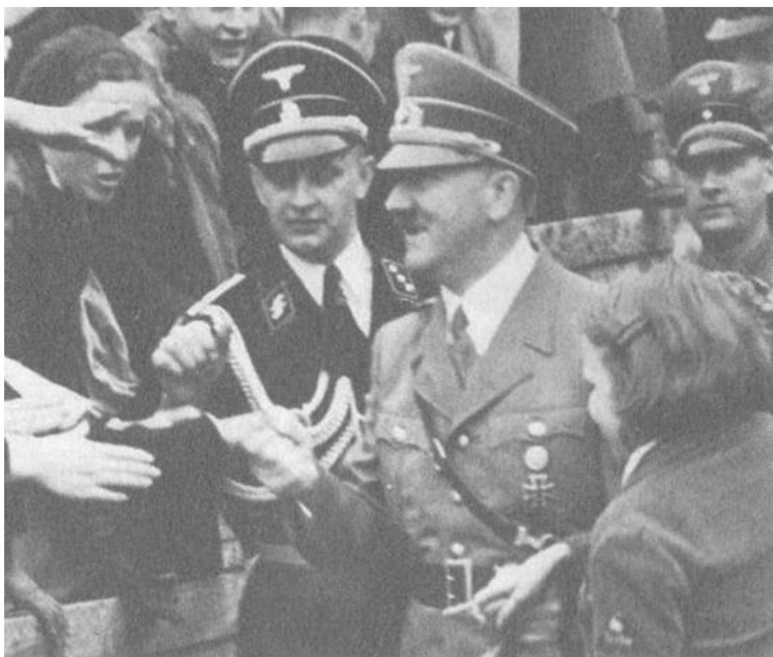
Хитлер и личният му помощник СС хауптшурмфюрер Хайнц Линге.

Хитлер. Във всеки случай за мене нещата винаги са стояли така: аз, офицерът от СС, вярвах, че при всяко едно положение би трябвало високо да развявам знамената, нещо, което редица военни и най-вече Ерих фон Манщайн винаги открито са поддържали, но невинаги са постигали. И въпреки положението на фронта, въпреки разрушените германски градове, липсата на суровини, оръжия и муниции не всички непременно стигаха до извода, че катастрофалният край наближава и е неизбежен - за това свидетелстват многобройните изявления на именити военни като Браухич например, който противопоставяше на действителността гения на Хитлер.