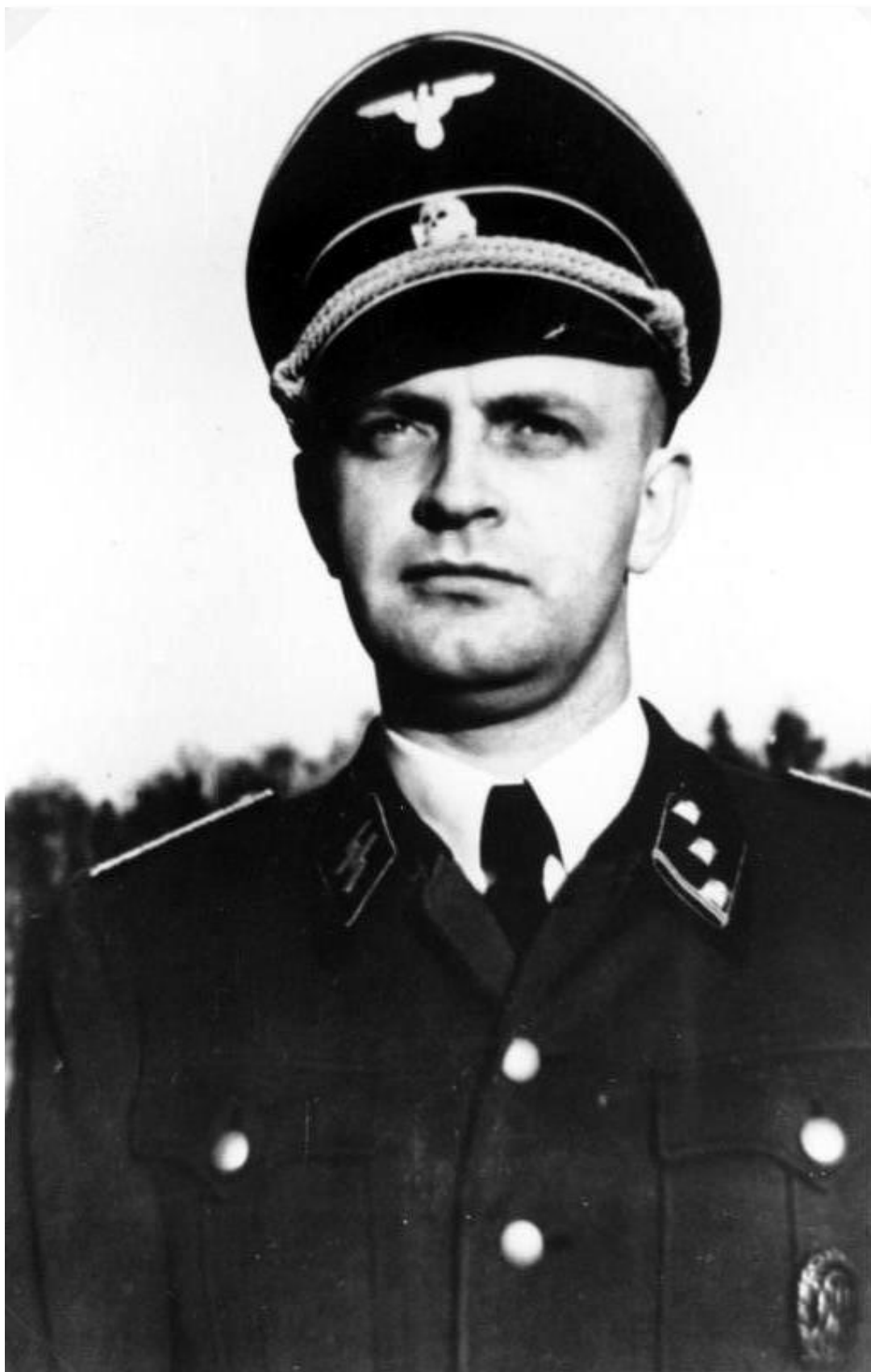
СС-оберштурмбанфюрер Хайнц Линге (23.03.1913 – 09.03.1980)