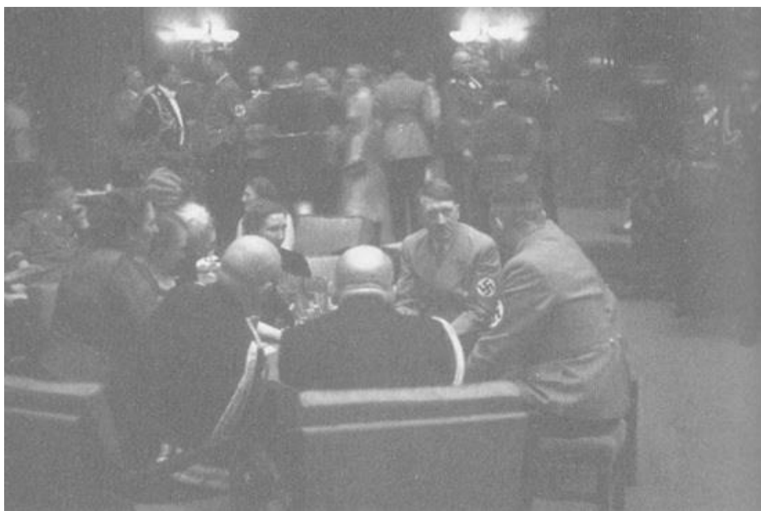
Мюнхен, 25 февруари 1939: официален прием в резиденцията на Хитлер „Фюрербай“.

Първоначалната показна резервираност скоро изчезна. Настроението по масите се освободи от напрежение. А настроението на Хитлер, неговият чар и старанието му да обгрижва всички бързо оказаха своето въздействие. За всекиго от гостите си лично отдели най-малко няколко минути. Бъбрейки, минаваше от маса на маса. Някои, и това им личеше, бяха изненадани от уменията на Хитлер.