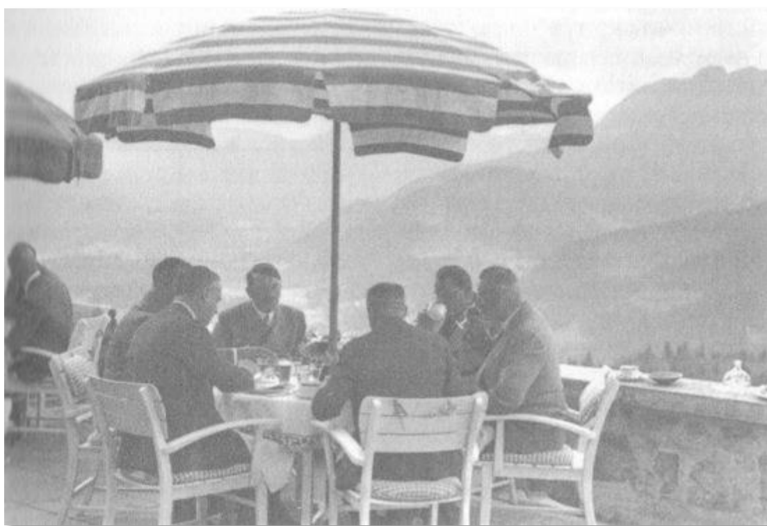
Обяд на терасата на „Бергхоф“, 22 август 1939, една седмица преди началото на войната срещу Полша. Хитлер обсъжда последните детайли от плана с Херман Гьоринг, Вилхелм Кайтел и външния министър Йоахим фон Рибентроп.

Обикновено по време на ядене Хитлер пиеше бира, а при официални поводи, когато се вдигаше тост, пиеше и по малко вино. Беше строг вегетарианец и не пушеше, но не отричаше алкохола. От удоволствието да пие бира се отказа едва по време на войната, приблизително през 1943 г., когато почна да напълнява в ханша и коремът му наедря. Не го смущаваше, когато всички наоколо пиеха. Но се отвращаваше от пияните. Когато веднъж на един прием у някакъв артист един от адютантите си беше „посръбнал“ и на сбогуване целуваше наред ръцете на дамите, Хитлер се уплаши, че адютантът му може съвсем да загуби контрол. По-късно в негово присъствие изимитира сцената по начин, който недвусмислено издаде трудно потиснатия му гняв.