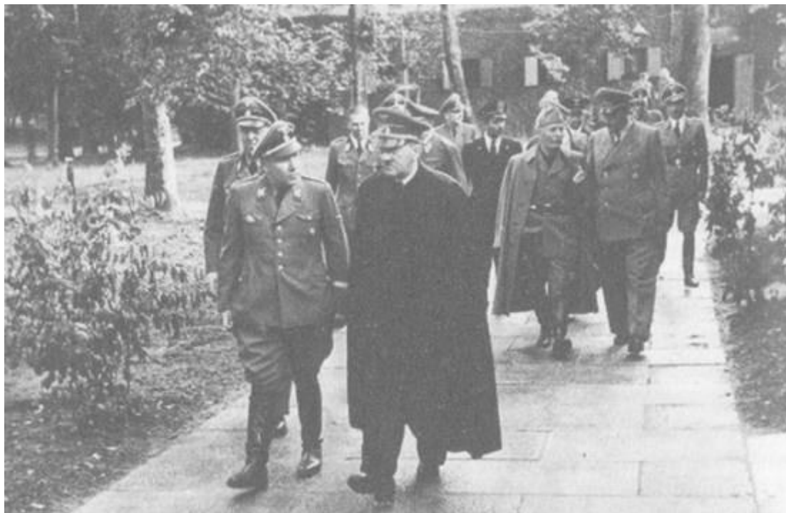
20 юли 1944, главната щабквартира на Фюрера „Волфсшанце“ край Растенбург. Мартин Борман разговаря с Хитлер малко след неуспешния атентат срещу него. На заден план пристигналият същия ден Бенито Мусолини.

Понеже непрекъснато се подвизаваше близо до Хитлер, Борман повече от всеки друг имаше поглед върху начина на мислене на Фюрера. Спестяваше на Хитлер не само много работа, но и нерви. Някои конференции на гаулайтерите ставаха излишни, защото Борман информираше директно щаба на ръководителите на партията. Когато войната започна, позицията му така се беше разгърнала, че той беше постоянно в щабквартирата на Фюрера като свързващо звено между него и партията.