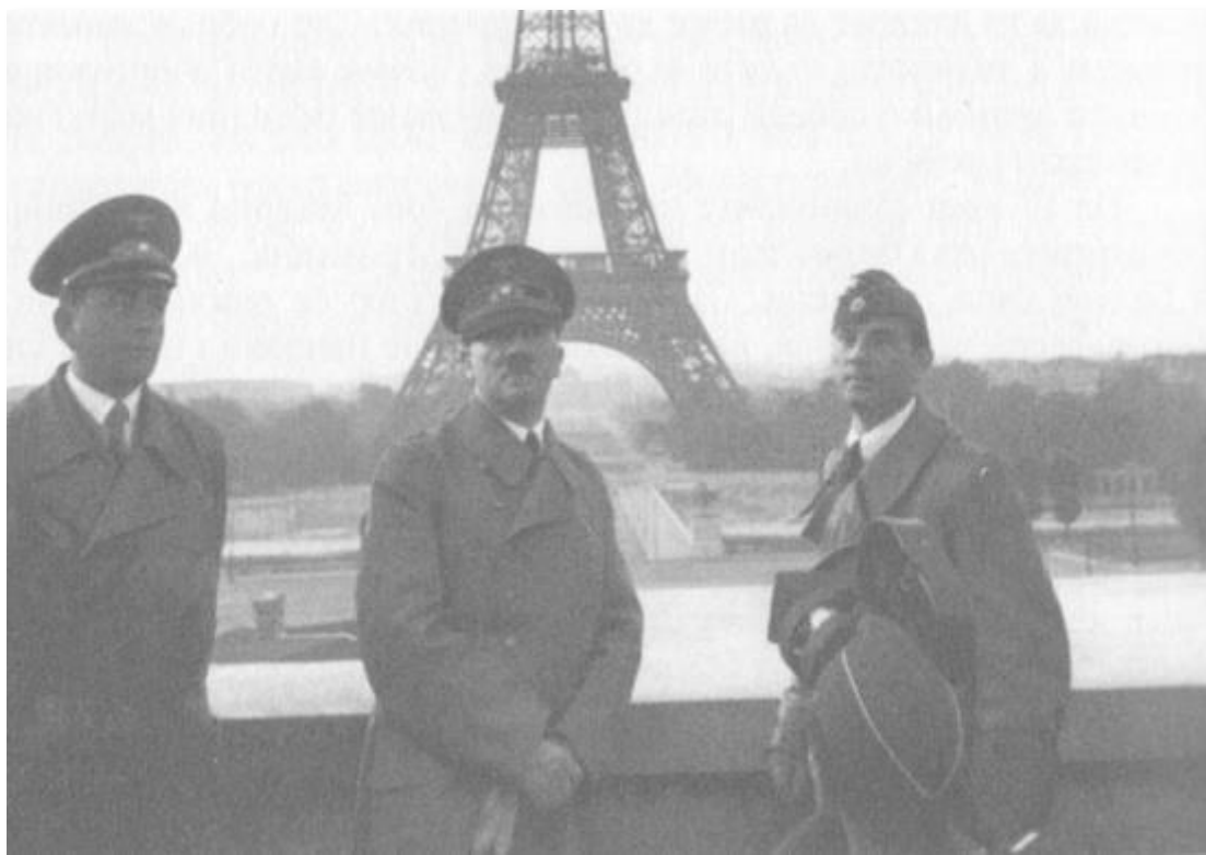
Париж, 23 юни 1940... Хитлер позира пред Айфеловата кула. Вляво Алберт Шпеер, вдясно скулпторът Арно Брекер.