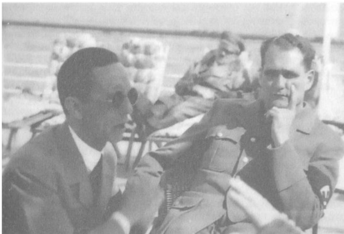
Гьобелс и Рудолф Хес разговарят на терасата на „Бергхоф”. На заден план Хитлер.