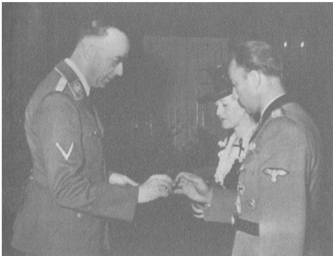
3 юни 1944. Райхсфюрерът на СС Хайнрих Химлер бракосъчетана Гретъл Браун и Херман Фегелайн. Химлер въвежда за СС специални ритуали вместо църковните.

За нас, които знаехме за връзката между Хитлер и Ева Браун от лични наблюдения, до 29 април 1945 г. важеше девизът: „Не виждам, не чувам, не казвам“. И така едва след войната стана общоизвестно, че Хитлер е поддържал дългогодишна любовна връзка с Ева Браун. Когато и да дойде хора, които не се числяха към тесния кръг около Фюрера, Ева си стоеше в своите покои. Като утеха тя канеше приятелки, г-жа Шпеер, жената на придружаващия Хитлер лекар Карл Бранд или госпожа Хофман и се опитваше да направи възможно най-доброто от ситуацията, в която се намираше. Нерядко нейната сестра Гретъл ѝ помагаше да убива времето. Илзе Браун, най-голямата ѝ сестра, особено интелигентна журналистка, която беше приятелка е един еврейски лекар, се държеше настрана от този кръг, в който Ева беше влязла. Затова пък Гретъл, средната, виждахме често, особено, след като Херман Фегелайн, представителят на Химлер при Фюрера, се ожени за нея.