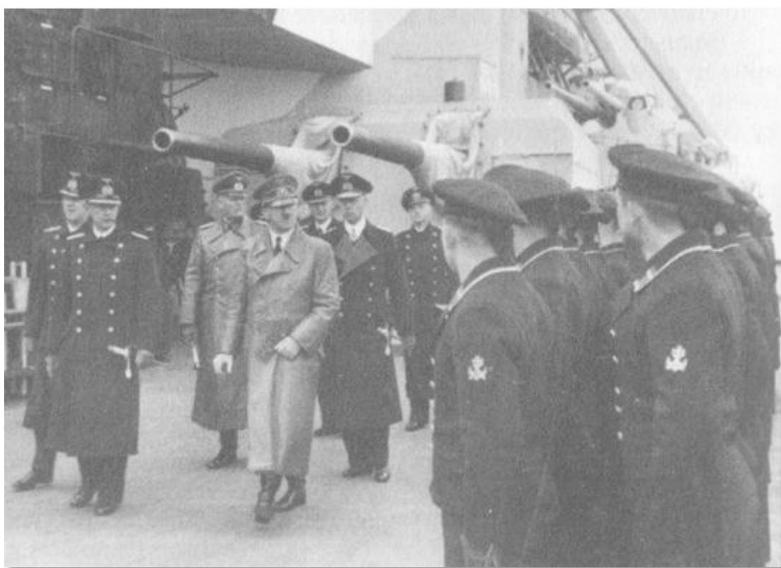
Гдиня, 4 май 1941 г. Хитлер инспектира линейния кораб „Бисмарк“ преди рейда му в Атлантика.

Путкамер, засегнат, замълча. А и какво би могъл да каже?