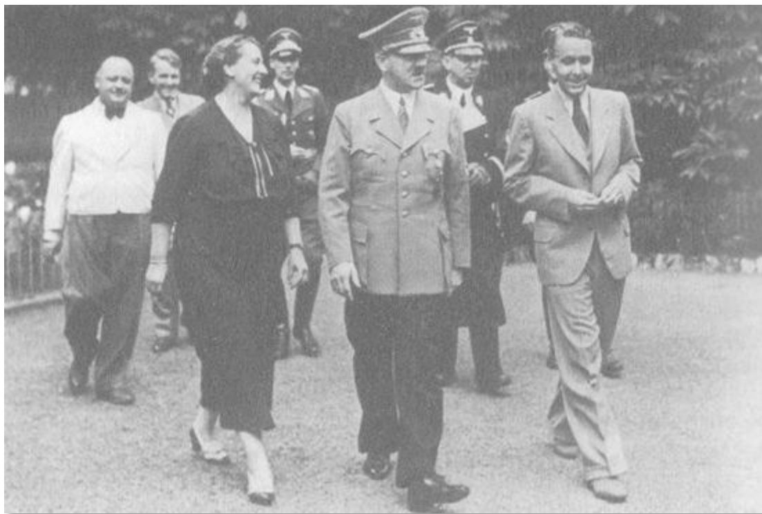
Байройт, 26 юли 1938, паркът на вила „Ванфрид“. Уинифред Вагнер и нейният син Виланд посрещат Хитлер, който е спонсор на ежегодния Вагнеров фестивал.

Вечер, разказваше той, се налагало да облича фрак и го правел против волята си, а след представленията се срещал в гостилница „Ойле“ с артистите, които участвали във фестивала и „естествено, го познавали“.