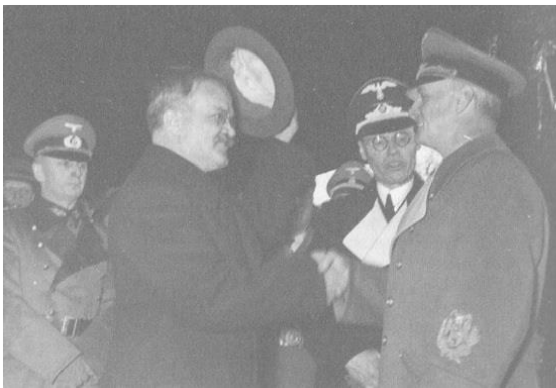
Берлин, гара Анхалт, 14 ноември 1940 г. Рибентроп изпраща съветския външен министър Молотов след посещението му в Германия.

- Той вече има своите заслуги - промърмори веднъж, след като Рибентроп го беше накарал да чака на телефона неприлично дълго.