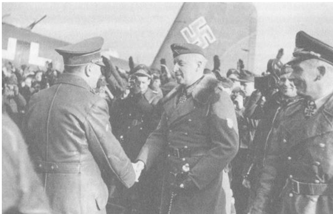
Запорожие, 10 март 1943... Хитлер пристига на посещение в групата армии „Юг”. Посреща го командващият фелдмаршал Ерих фон Манщайн. Вдясно на заден план личният пилот на Хитлер Ханс Баур.

За обедите с войниците в повечето случаи се подреждаха маси и пейки. На Хитлер даваха чиния с грах, от която предварително трябваше да се извади месото. Заедно с мен обаче сядаше и до „унищожители на гулаш“ и двамата дружно сърбахме грахова чорба.