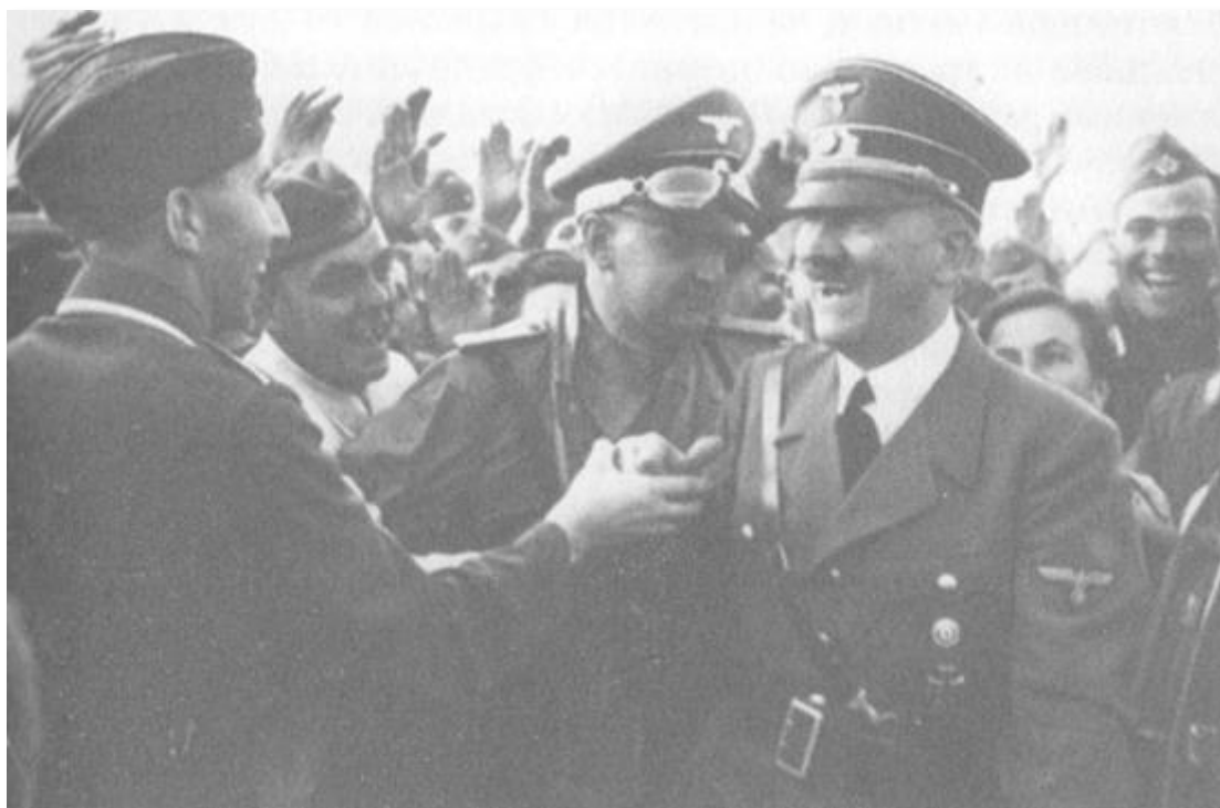
Полша, септември 1939... На фронта сред войниците (вляво от Хитлер - Хайнц Линге).

Хитлер се държеше, сякаш се намира на маневри. Пътуваше с бронирана разузнавателна кола, когато тръгваше към фронта, минаваше почти всекидневно през гори и какви ли не непроходими места, където навсякъде се криеха полски снайперисти. Веднъж, минавайки през една гора на брега на Висла, се натъкнахме ма брутално избит 20 минути по-рано от поляците германски санитарен отряд. Хитлер се вбеси и промълви: