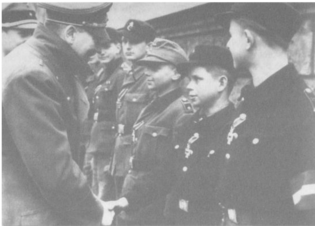
20 март 1945... Хитлер поздравява момчета войници от „Хитлерюгенд“, които са се отличили в боевете.

- Линге, не съм спал още. Събудете ме час по-късно от обикновено, в 14 часа.