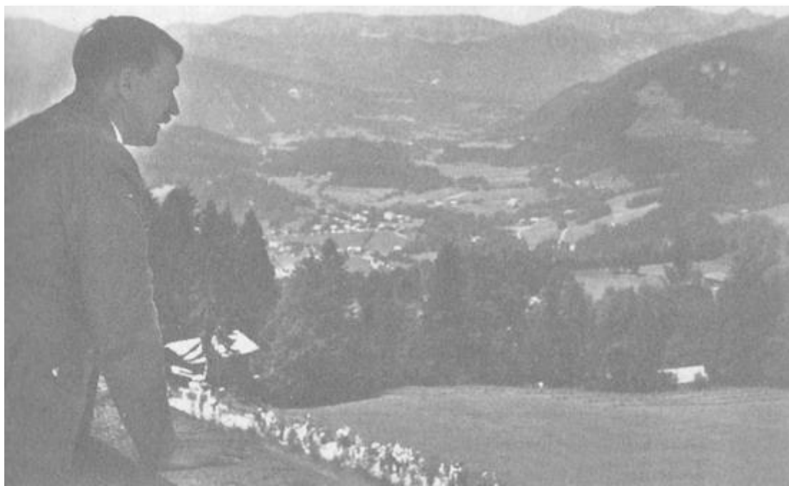
Поглед от терасата на резиденцията на Хитлер „Бергхоф“ към Оберзалцберг.

гигантските върхове наоколо му, които се затварят в голяма арка в далечината, приближават сякаш и се струпват зад Оберзалцберг в Хоен Гьол... Тук, посред тая величествена природа... живее Фюрерът, тук подготвя великите си речи.“