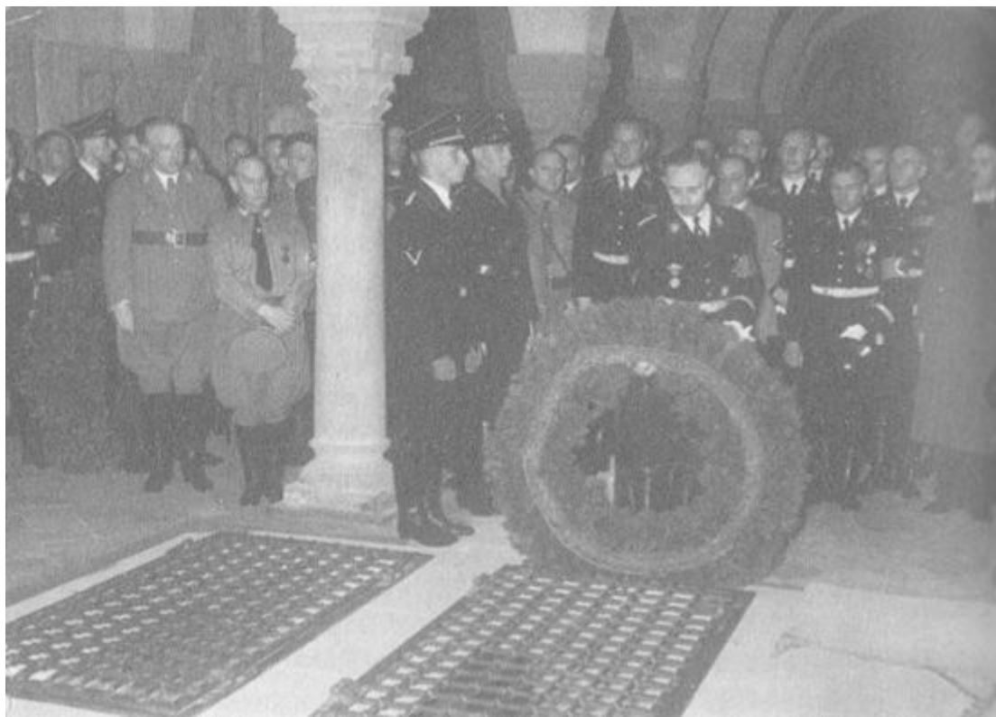
Катедралата в Кведлинбург, 1 юли 1938. Химлер полага венец на гроба на германския император Хайнрих I. Райхсфюрерът на СС вярва, че 1 000 години след смъртта си императорът се превъплътил в него.

- И майка ми не е имала спортен медал, но мисля, че въпреки това станах доста добър германец.