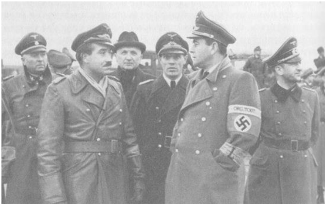
Полигонът Рехлин, септември 1943. Министърът на въоръжението Алберт Шпеер (отдясно) и командващият изстребителната авиация Адолф Галанд наблюдават демонстрация на нови оръжия.

- Индустриалните магнати може би мислят, че съм полудял. Но аз се чувствам само като посредник между фронта и промишлеността. Последната трябва да е толкова гъвкава, че да може да отговори на всички изисквания на фронта, независимо дали днес става въпрос за танкове, утре за противотанкови или зенитни оръдия. Не му е лесно на Шпеер.