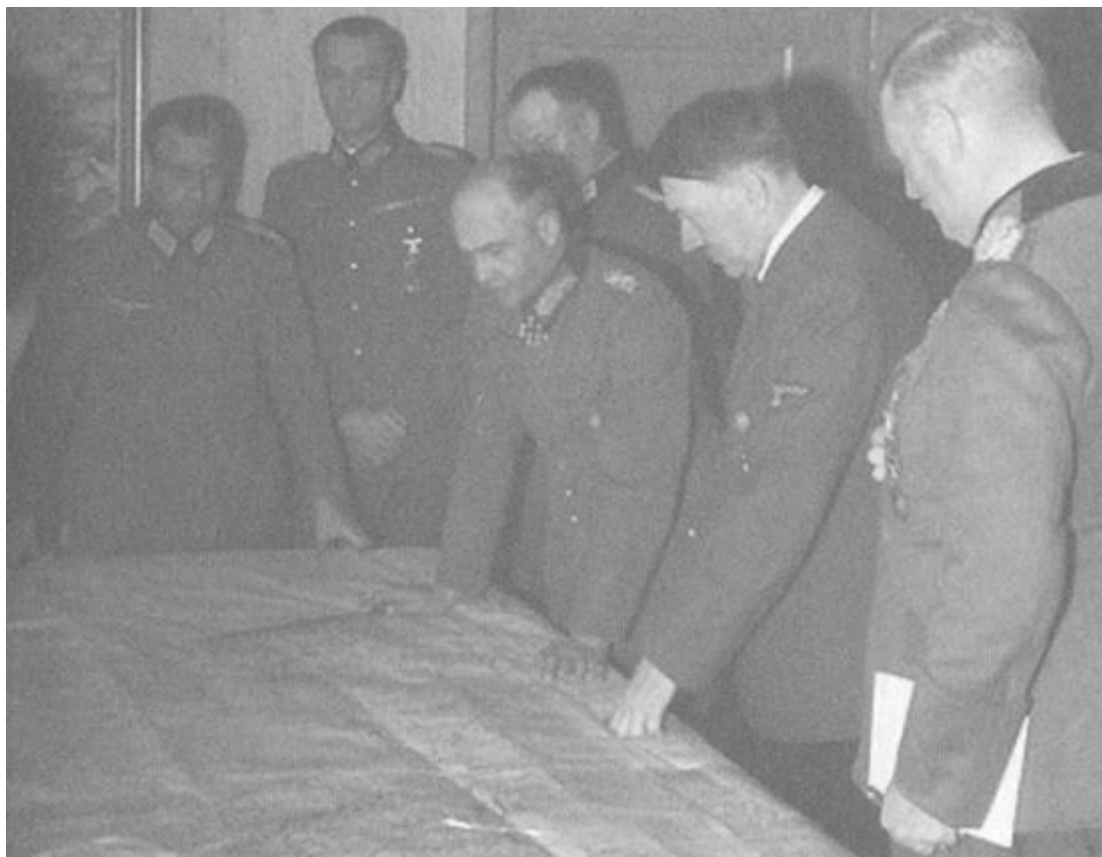
Щабквартирата „Волфсшанце“, юли 1941... Хитлер, Кайтел и главнокомандващият сухопътните сили Фон Браухич над картата с оперативната обстановка на Източния фронт (на заден план Фридрих Паулус, първи зам.-началник на Генералния щаб на сухопътните сили).

- Шлифен ли? Учениците в генералски униформи имат точно толкова малка представа от практиката на войната, колкото и вашият Шлифен, на когото никога не се е налагало да доказва във война качествата си на пълководец. Те явно не могат да си представят, че французите също го познават и са подготвени за неговата намеса.