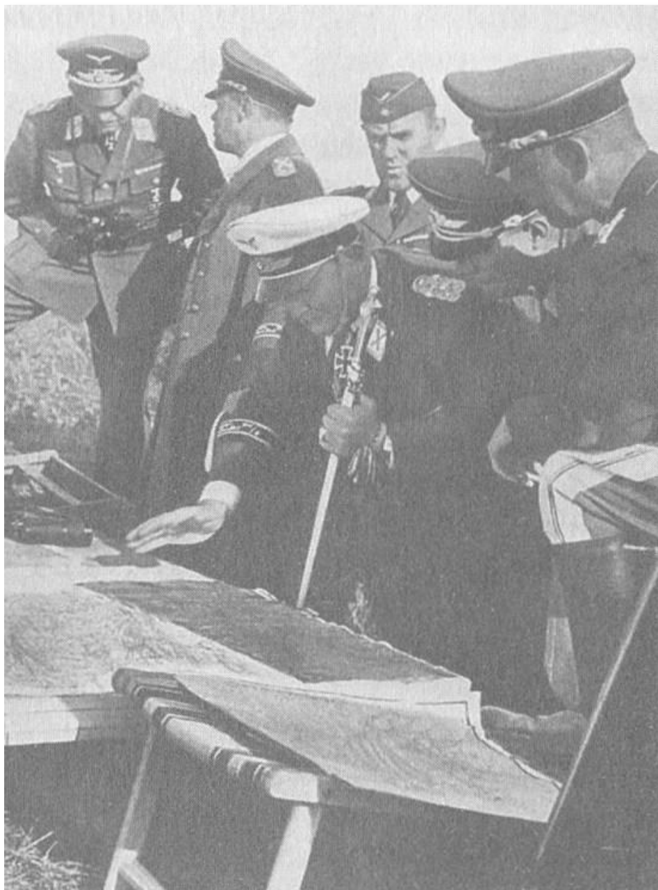
Гьоринг на посещение в полеви щаб на Луфтвафе по време на Битката за Англия, лятото на 1940 г.

за скорошно съглашение с Лондон, охотно се съгласи с Гьоринг. Но както тук, така и в Сталинград Гьоринг не можа да удържи на обещанията си.