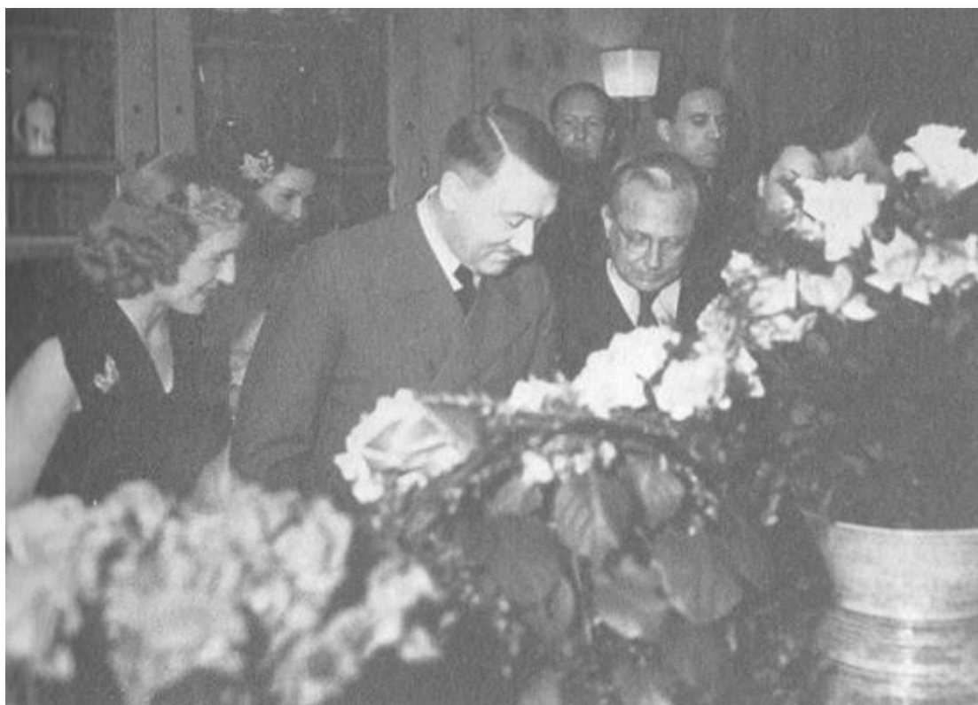
„Бергхоф”, 20 април 1944. Ева Браун и Хитлер на 55 -ия му рожден ден. Отдясно фотографът Хайнрих Хофман.