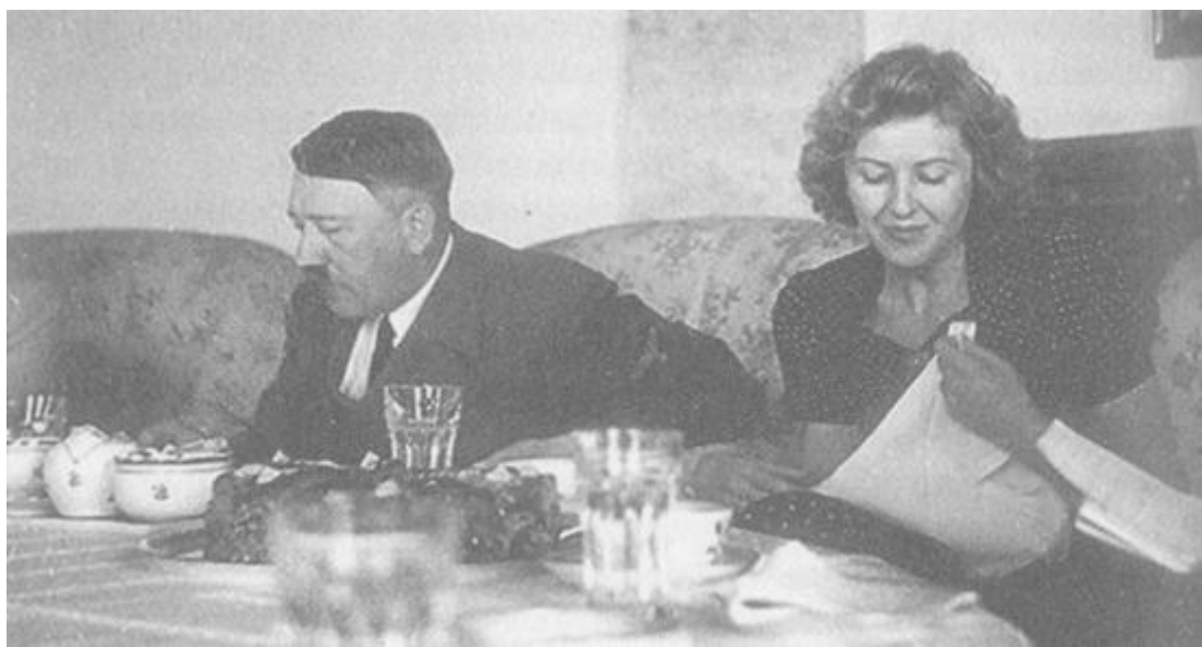
Хитлер и Ева Браун в чайната на връх Келщайн. По-късно американците наричат тази вила на Хитлер „Орлово гнездо“.

Поради същата причина например се отказа и от това, поне така твърдеше, да се обвърже официално с жена или да признае пред обществеността връзката си с Ева Браун. Затова тя беше пазена в строга тайна. В началото естествено самият аз не знаех, че младата руса дама, която постоянно седеше на масата до него отляво, е тайната му любовница. Запознали се бяха през 1932 г. при фотографа Хайнрих Хофман и скоро след това Хитлер я взел при себе си. Ева Браун работеше при Хофман, който постоянно се моташе край Фюрера, за да фотографира, затова в началото не се замислях над това. Разбира се, правеше ми впечатление, че Хитлер се отнася по много особен начин към красивото момиче, но го приписвах на външността и характера на Ева Браун. Нейната естественост и простодушие бяха много симпатични, а чарът и грациозната ѝ осанка омагьосваха всички ни. Когато Хитлер оставаше в Оберзалцберг, постоянно я канеше. Тя произхождаше от добро семейство.