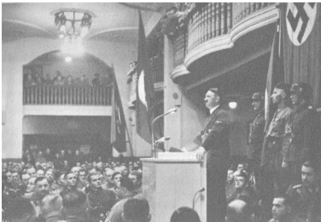
Мюнхен, 8 ноември 1939 г. Хитлер произнася традиционната си реч в „Бюргербройкелер“.

установяване на извършителите беше обявена награда от 500 000 марки, сумата бе увеличена на 600 000 от частно лице. Опустошителната експлозия в „Бюргербройкелер“ избухна към 21:20 часа, по време, когато Фюрерът вече беше напуснал залата на път към гарата, придружен от почти всички ръководители на движението, Райхслайтери и гаулайтери, където той се качи на влака веднага след като приключи речта си, за да замине за Берлин поради неотложни държавни дела. Цяло чудо е, че Фюрерът оцеля след този атентат, който целеше не само да отнеме неговия живот, но и да разклати сигурността на Райха“ 6 .