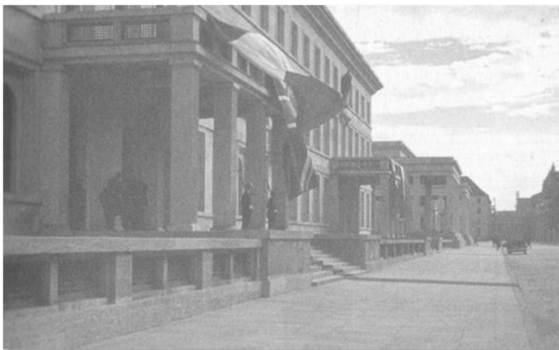
Официалната резиденция на Хитлер на „Кьонигсплац“ в Мюнхен, построена по проект на архитект Паул Лудвиг Троост.

Това, което тук се случва, ще преживее и Берлин и бих искал да си пожелаая двата града да встъпят в благородно съревнование в смисъл такъв - всеки един от тях да се опита да надмине другия в осъзнаването на необходимостта от поставената задача. Разрешаването на транспортните задачи е в основата на голямата цел, която преследваме с преустройството най-вече на Берлин, Мюнхен и Хамбург 12 .