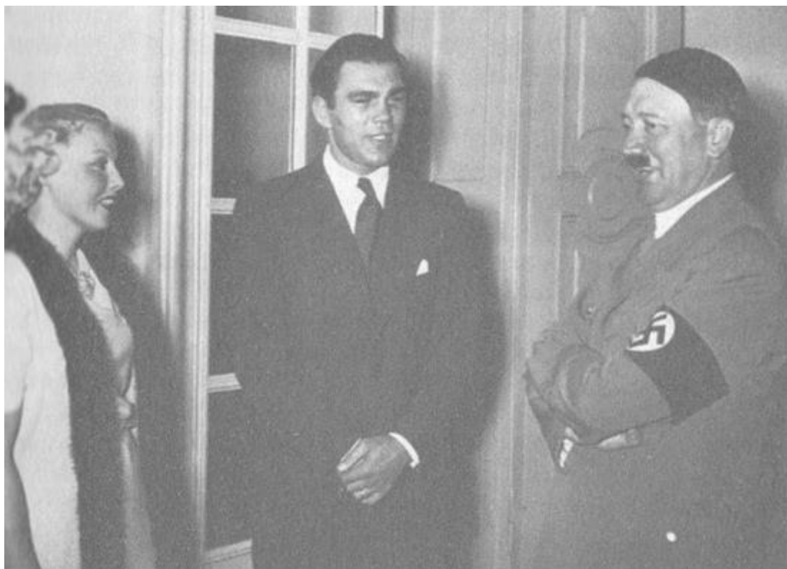
Берлин, 6 юли 1936... Хитлер приема в Райхсканцеларията световния шампион по бокс тежка категория Макс Шмелинг и съпругата му, актрисата Ани Ондра.

- Не смятате ли, че имаше жени, които и в най-отбрано общество биха направили впечатление? От средите на народа израства аристокрация, на която спокойно можем да разчитаме.