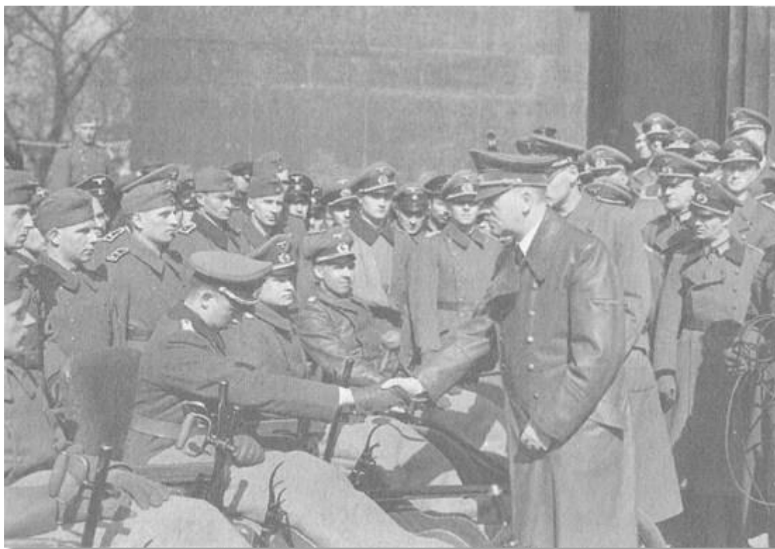
Берлин, 21 март 1943... Хитлер сред ранени на Източния фронт войници и офицери.

освободители. Лицето на Хитлер изобщо не трепна. Чертите му бяха отпуснати. От време на време, за секунди само, издаваха нещо като лека изненада. Изведнъж обаче, наблюдавах го непрекъснато, лицето му се „вкамени“. Погледнах към екрана и видях причината: украински жени, деца и старци носеха кръстове в ръцете си и се кръстеха. В Полша, Франция, Белгия и Холандия например той навярно само би се усмихнал на такива картини. Тук беше съвсем различно.