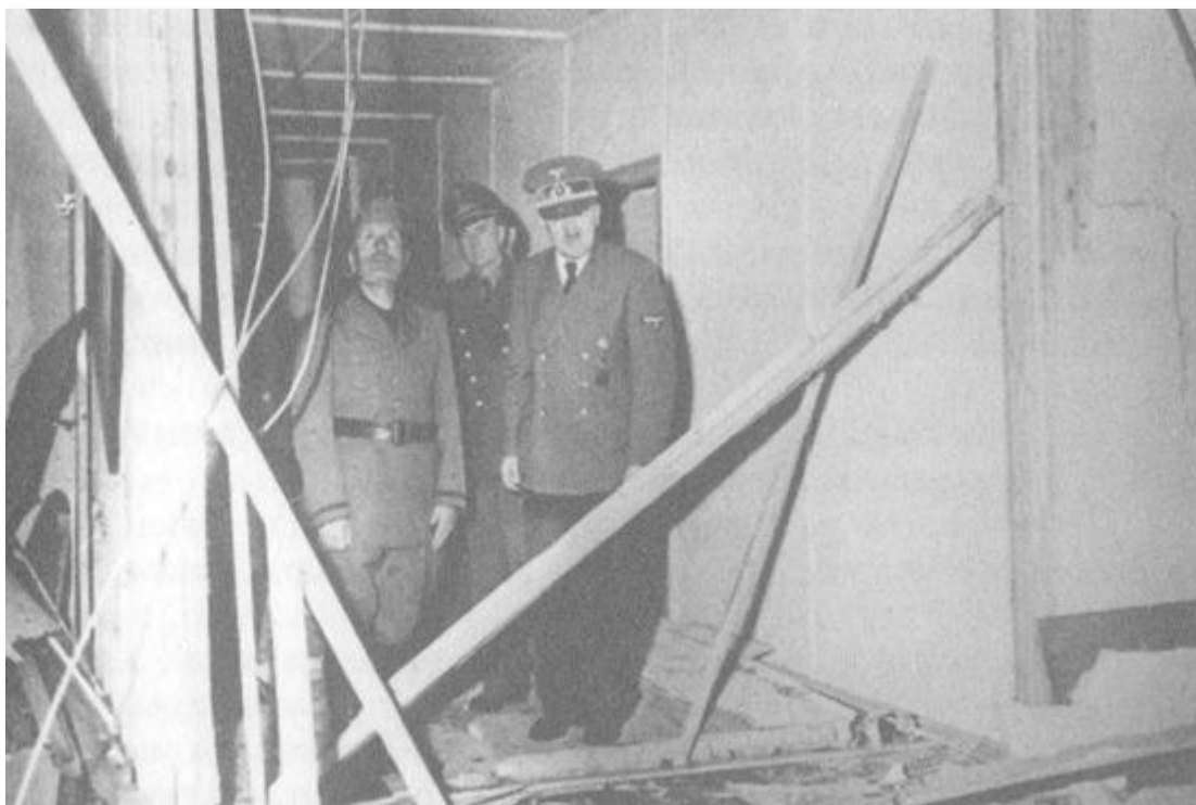
„Волфшанце” 20 юли 1944... Хитлер показва на Мусолини разрушенията след експлозията.

- На вашето мнение съм и аз. Това е знак от Небето.