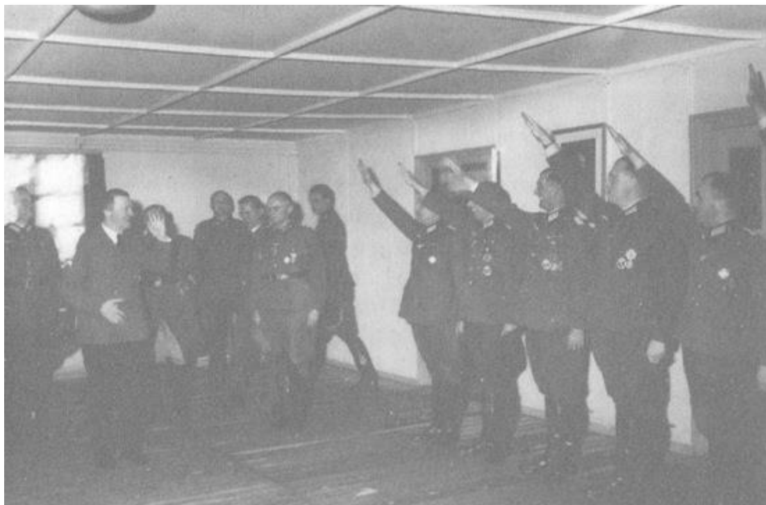
Главната щабквартира „Волфшанце“. Церемония по награждаването на фронтови офицери от Вермахта (най-отзад до стената е застанал Хайнц Линге).

хвърляше по един поглед, след което можеше да ги повтори наизуст, стига това да се налага. Невероятната памет, както и енергията му не го напускаха и в тази фаза от живота му. И в тези времена си оставаше гигант, който засенчваше всичко наоколо си. И той го знаеше; но въпреки това беше неспокоен, нащрек и подозрителен по отношение на всички. Освен на Дьониц, Гьобелс, Борман и на нас, т. е. на най-тесния кръг около него, на никого повече не вярваше за нищо на света. Навсякъде наддушваше опасност или бойкот. И както показаха последвалите събития, това не беше без основание. Дори Химлер беше преговарял „с врага“ въпреки волята му, както се разбира накрая.