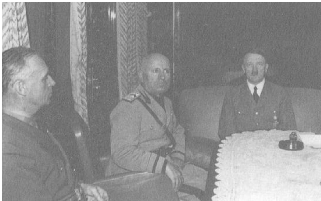
Проходът Бренер, 4 октомври 1940... Среща между Хитлер и Мусолини в специалния влак на Фюрера (отляво на Мусолини Райхсминистърът на външните работи Фон Рибентроп).

- Те - каза той - ще препречат Гибралтар и ще превърнат Средиземно море в кипящ казан. Нито един английски кораб не би могъл тогава да се измъкне от капана. Ако не направят това, ще завземат вероятно Малта, за да поемат контрола над Средиземно море.