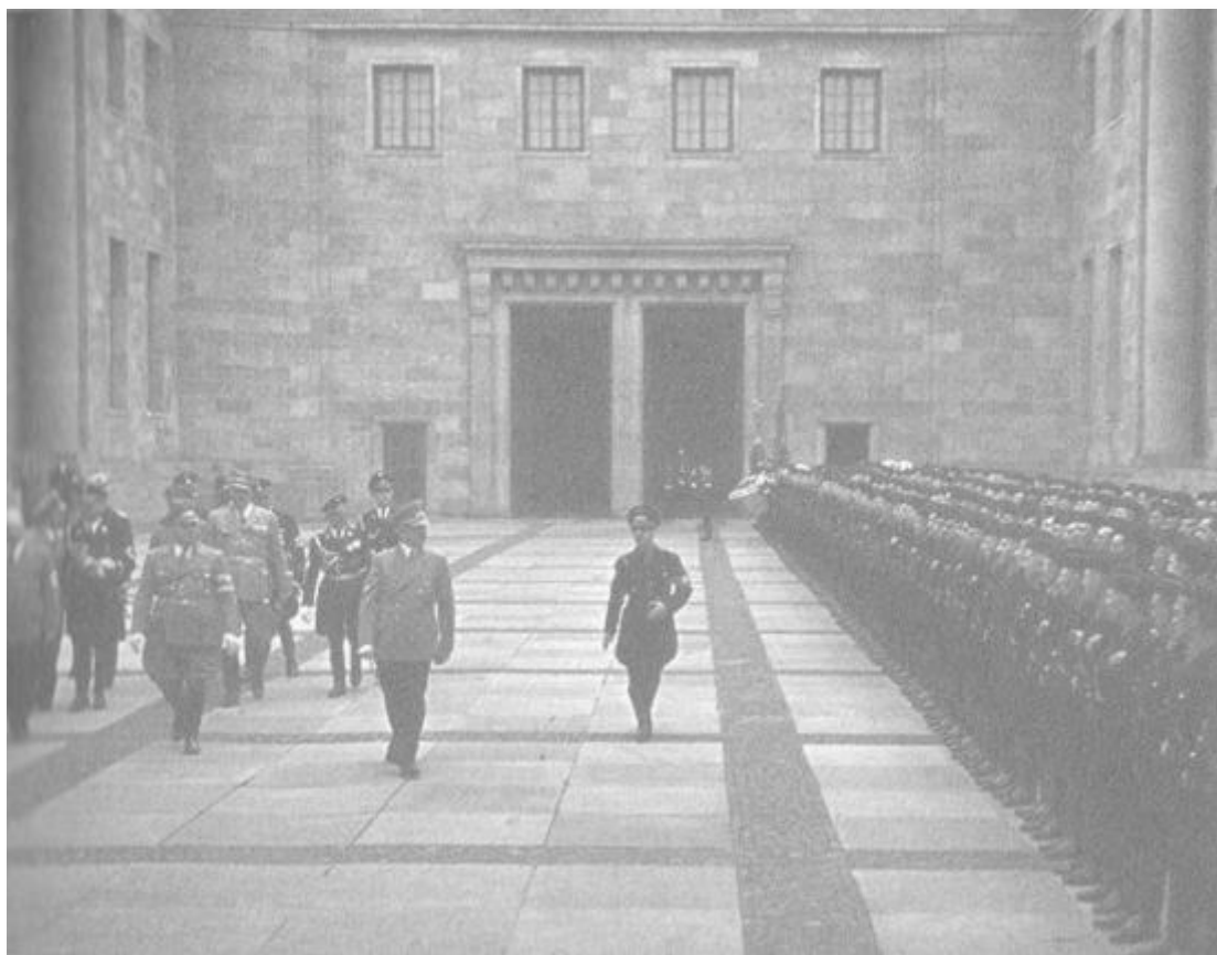
Хитлер прави преглед на СС лейбшандарта във вътрешния двор (почетния плац) на новата Райхсканцелария.

пиха възлезли на стойност 350 милиона германски марки. Мислите и действията му се въртяха само около архитектурата, която трябваше да играе централна роля в културната политика, да се превърне в символ на виталността и вярата в бъдещето на новия Райх и естествено да служи на целите на пропагандата и да представя Третия Райх като империя на възхода. На площ от 421 на 402 м беше разположена великолепна градина, която обхващаше и стария парк, в който някога се беше разхождал Ото фон Бисмарк. Неговият портрет, живописно платно от Ленбах, висеше над мраморната камина на Хитлер в кабинета му.