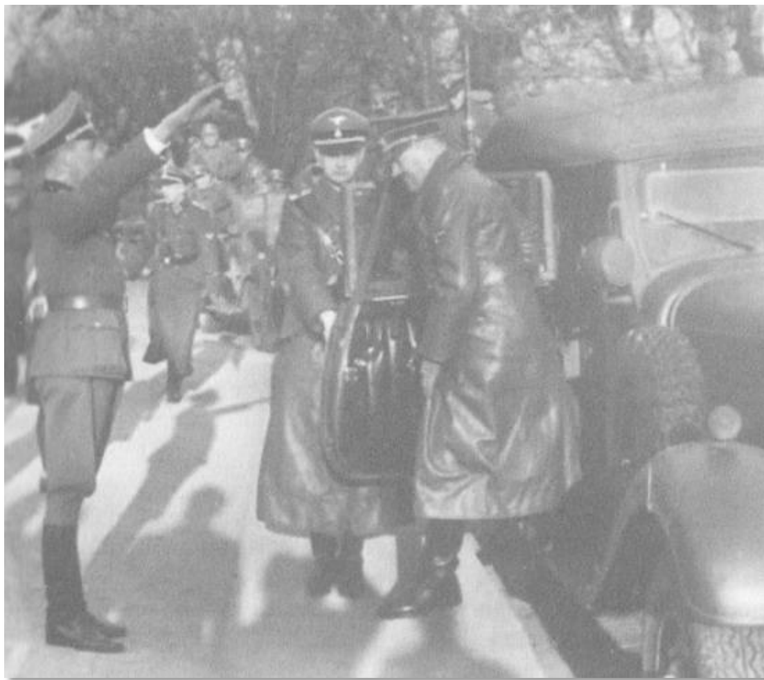
Хитлер слиза от триосния всъдеход „Мерцедес-Бенц”, модел G4 W31, с който посещава фронта. Линге придържа вратата на бронирания автомобил.

Първият атентат срещу Хитлер, който стана общоизвестен и прикова вниманието на целия свят, се случи през 1939 г. в Мюнхен. Хитлер се отърва на косъм от смъртта. В Мюнхен, в така наречената „столица на движението“, всяка година в навечерието на Деня на марша към „Фелдхернхале“ на 9 ноември 1923 г. в Бюргербройкелер“ се провеждаше другарска среща на „старите бойци“, в която Хитлер винаги участваше. През 1939 г., два месеца преди събитието, беше избухнала войната и Хитлер, който искаше преди обяд на 9 ноември да е в Берлин, нареди събранието да започне по-рано, а традиционната дотогава среща със старите съратници преди това отпадна. Тази реорганизация в последния момент спаси живота му.