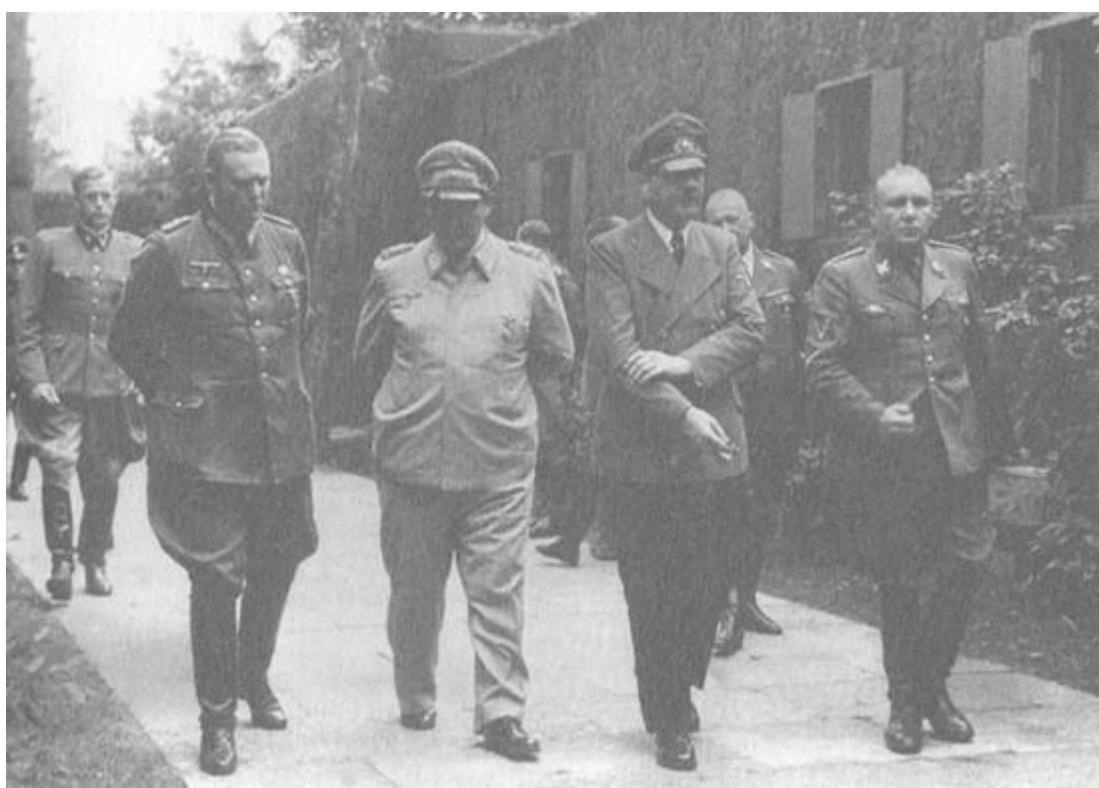
„Волфсшанце“, 20 юли 1944, след атентата... Хитлер се държи за ранената ръка, вляво Кайтел и Гьоринг, вдясно Борман, на заден план адютантът Ото Гюнше.