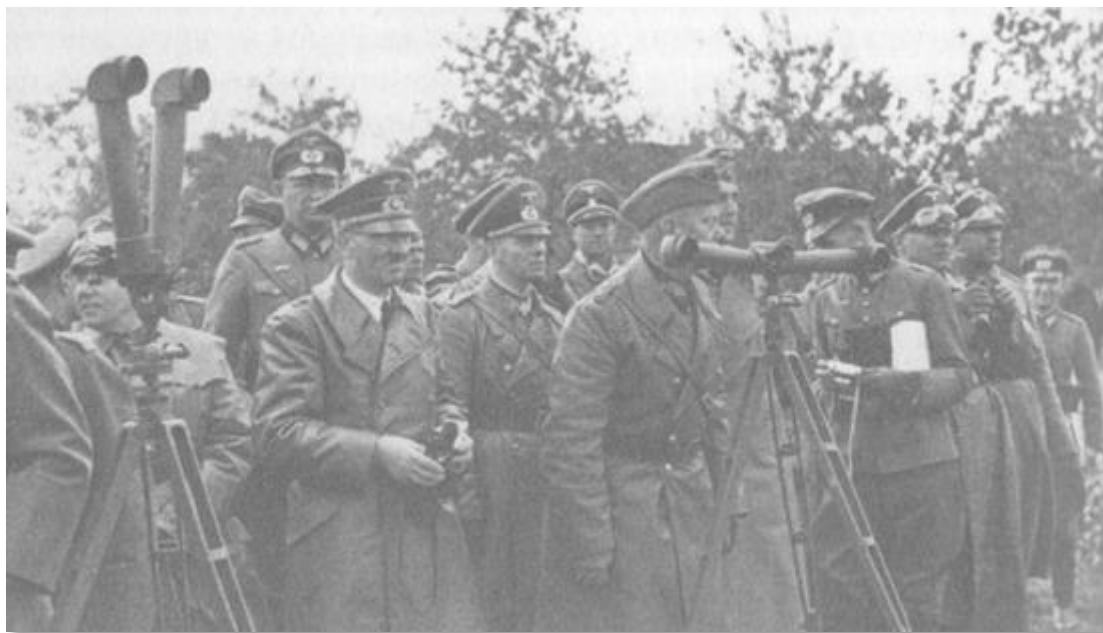
Полша, септември 1939... Хитлер и щабът му (генерал Ервин Ромел вдясно от него) на наблюдателния пункт на генерал Валтер фон Райхенау, командващ 10 -а германска армия.

От казино-хотела в Сопот, където беше устроена щабквартирата, Хитлер посети полуостров Хела. Там поляците чак до началото на октомври оказваха упорита съпротива. Най-много го интересуваше как са се отразили тука нашата корабна артилерия и бомбите на „щуките“. Струваше ми се, че вървя през гора, в която са изсечени всички дървета. Че по-голямата част от нашите градове и почти цяла Европа няколко години по-късно щяха да изглеждат по същия начин и тази война ще бъде Втора световна и ще трае шест години, и ще струва живота на повече от 40 милиона души, това нямаше как да предполагам. Подобна представа ми изглеждаше в момента невъзможна. Ние успяхме да „вградим“ в Райха областите Саар и Мемел, Судетите и Австрия, и то без сериозна съпротива, сега за по-малко от три седмици подчинихме Полша, а нейните съюзници, британците и французите, гледаха като парализирани. И дори нещо да се промени, последният батальон на бойното поле, в това бях твърдо убеден на фона на успехите на Хитлер, ще бъде германски.